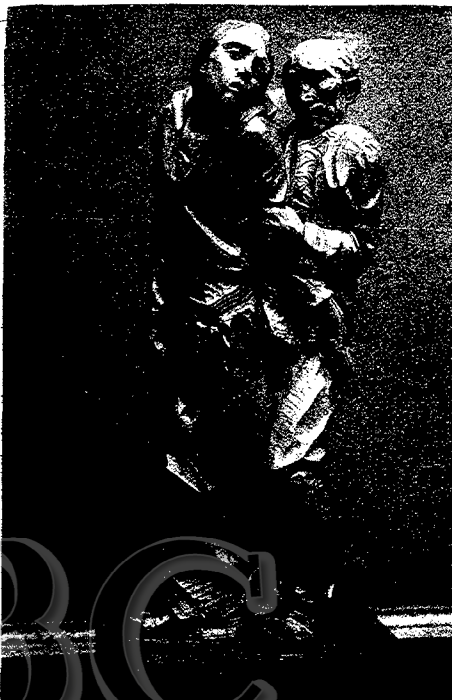
GRUPO ESCULTORICO, POR BONOME

Ni en texto ni en reproducciones fotográficas puede tener este artículo, de ojeada rápida a las salas de otoño, la extensión