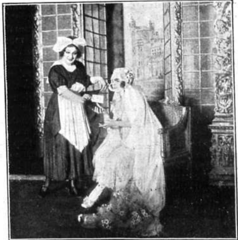
Madrid. Una escena de la obra: Nancy , estrenada con excelente éxito en el teatro de la Zarzuela.