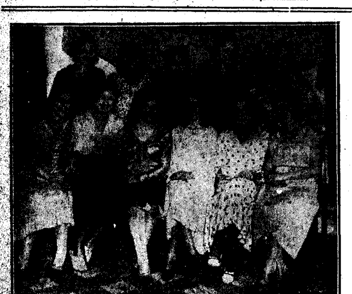
Señoras que se presentaron al concurso celebrado en la «kermesse» benéfica de la barriada de Bellas Vistas para la elección de «Señorita República».

El afán federalista no debe constituir obstáculo para el desarrollo de una recta conciencia internacional del país.