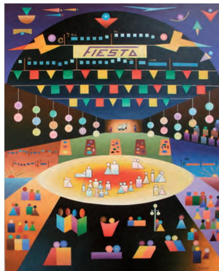
Fiesta 92 x 73 cms.