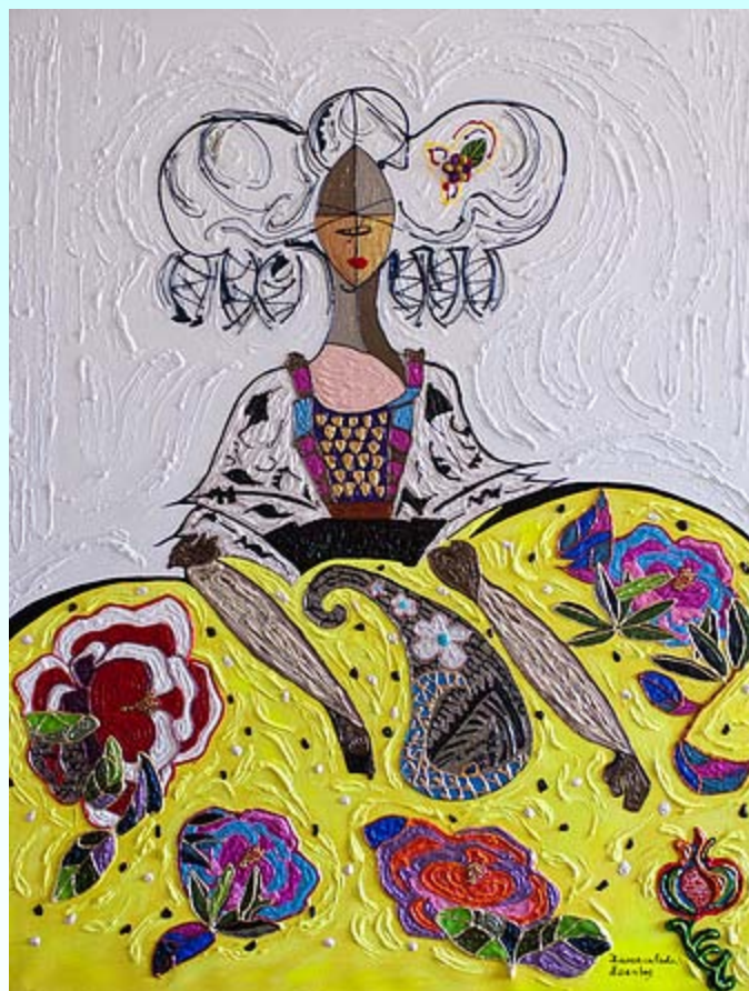
Menina Tristia Acrílico/lienzo 116 x 89