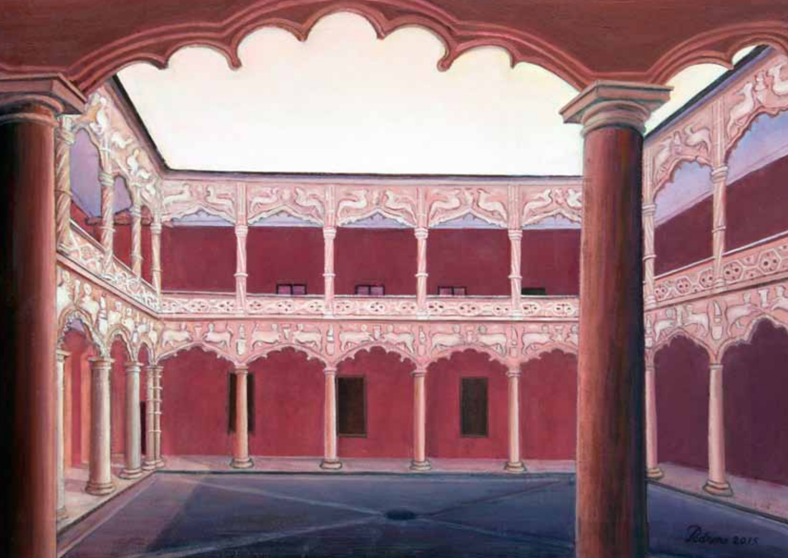
Palacio del Infantado