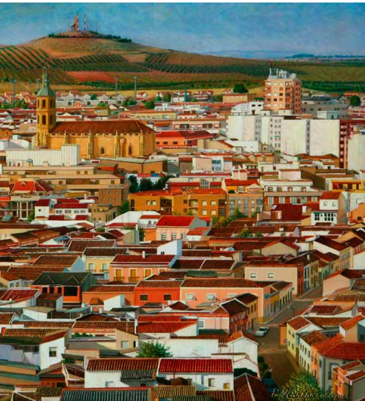
Valdepeñas al atardecer