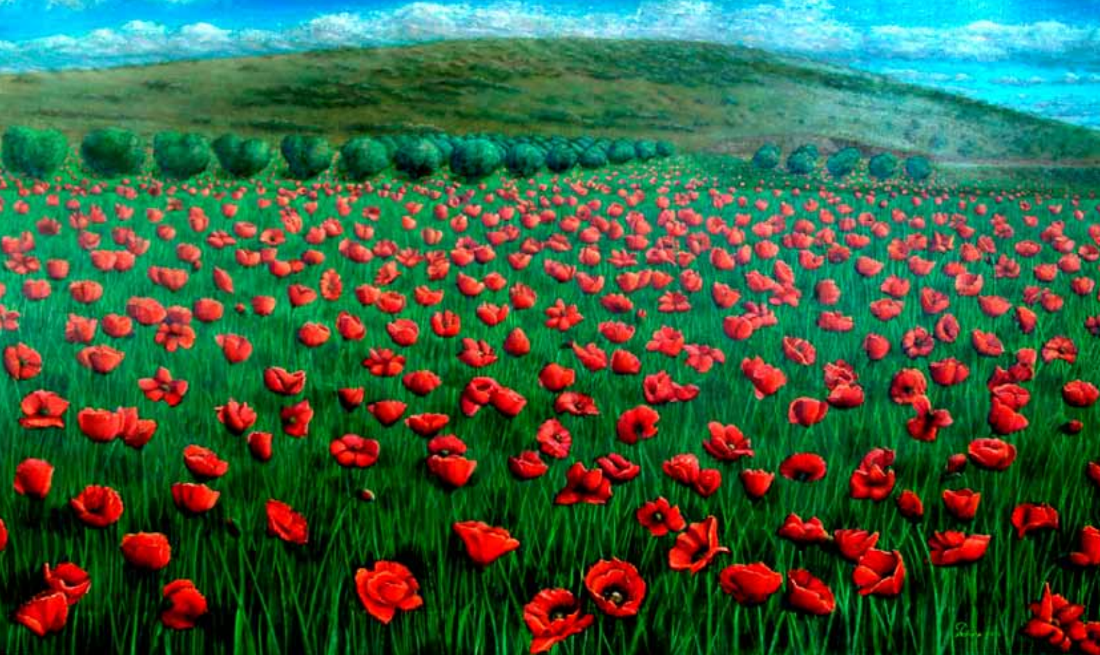
Campo de amapolas