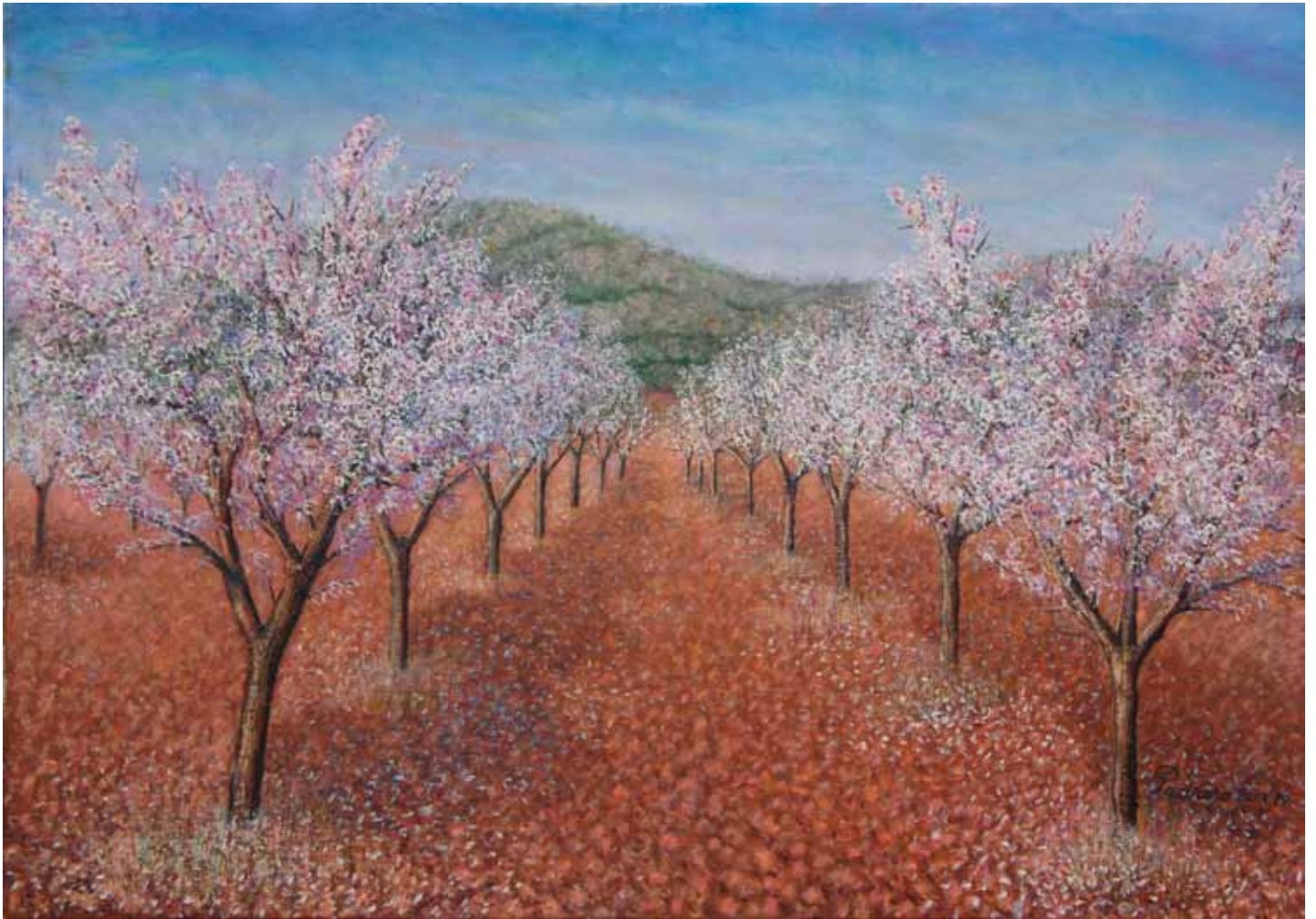
Almendros en flor

“Buscar su estilo” es seguir “la voz de su amo” hacerse compacto; desvivir; buscar lo homogéneo a sabiendas de que es una misión imposible, un rumor inconfirmable, un sueño dogmático de la razón. “Buscar su estilo” es un afán psicológico, la angustia del hacedor que solo afectará a las obras dadas al mirar en la medida en que ellas lo permitan. A esto se añade que el retrato, incluso el reflejo de la costumbre (iglesias, monumentos, paisajes, y en general “bodegones” superdimensionadas a los que Pedrero es tan dado).