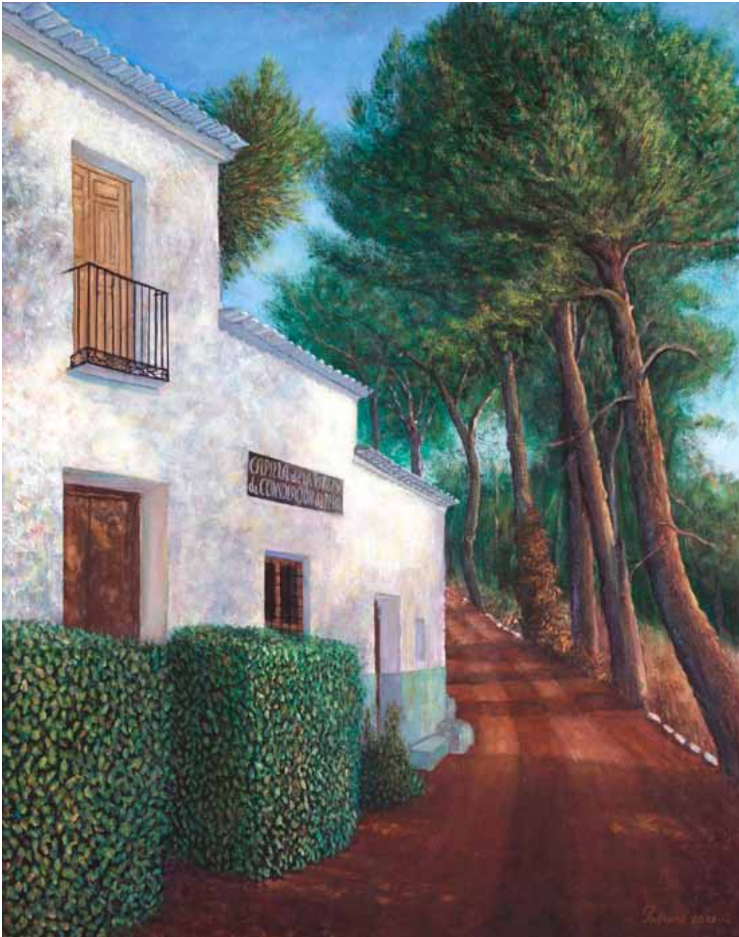
Capilla de la Virgen de Consolación de El Peral