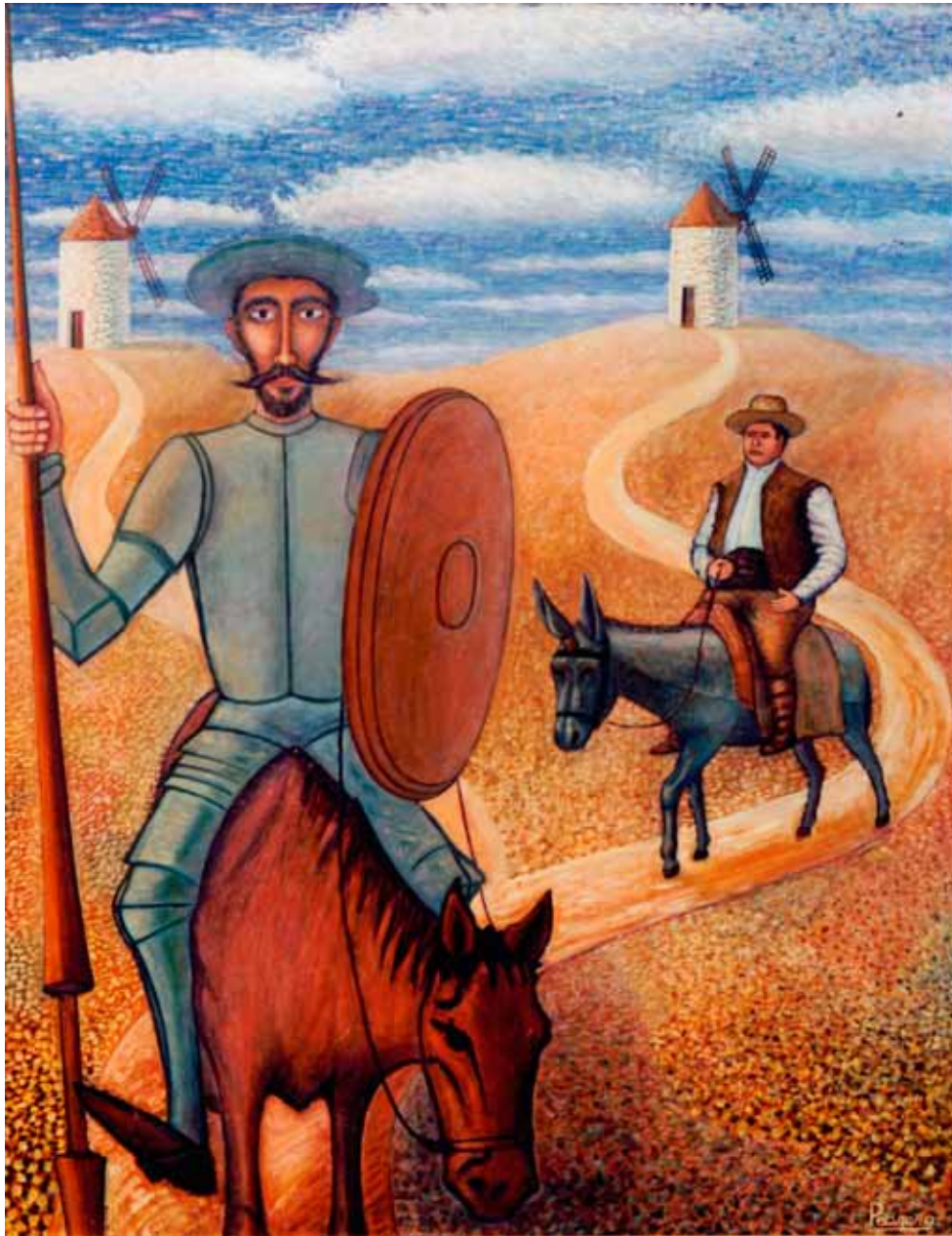
D. Quijote de la Mancha y su fiel servidor