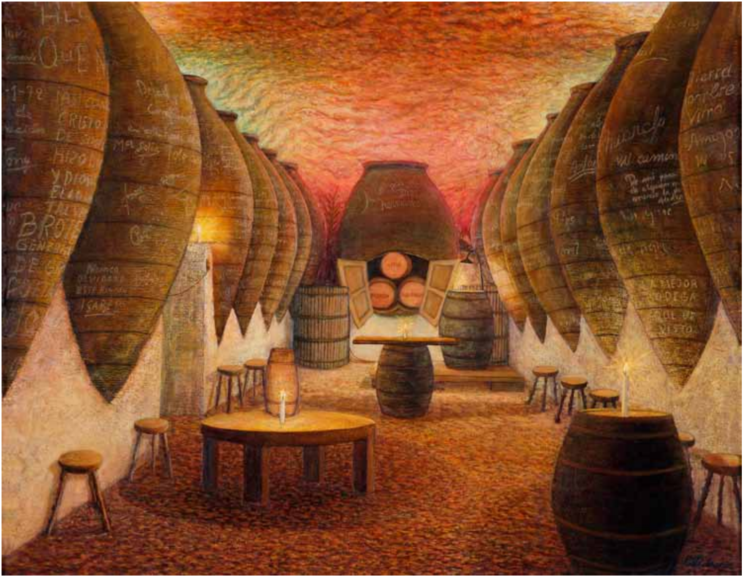
Cueva del Trascacho