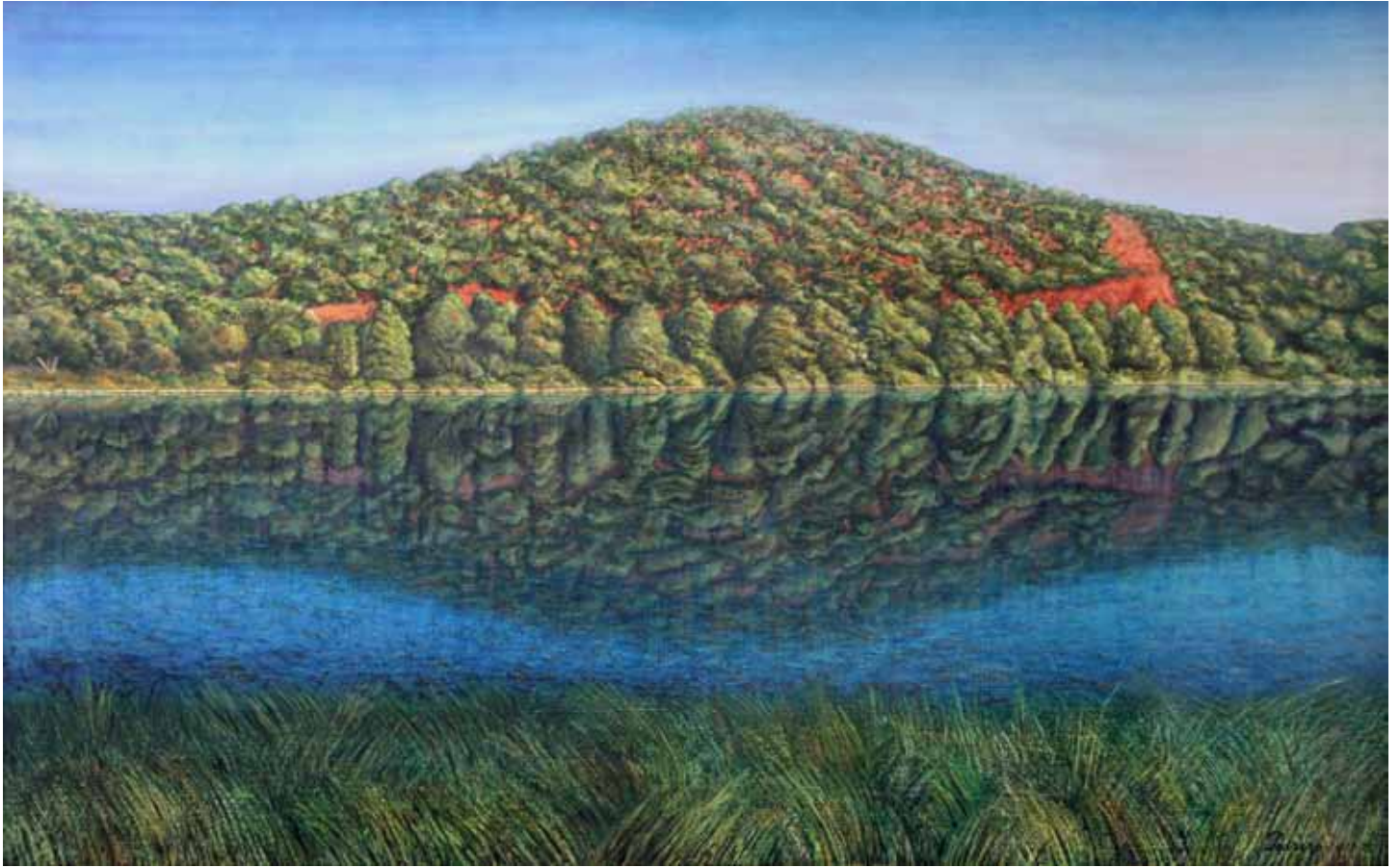
Retrato versión de El Greco