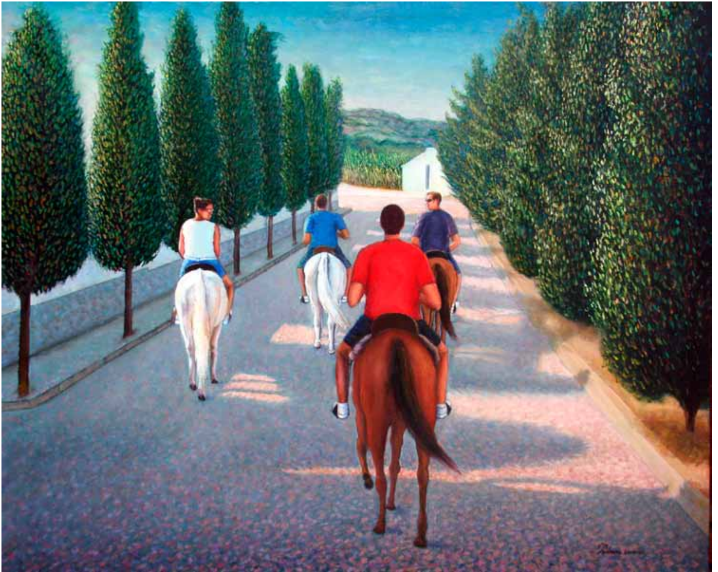
Caballistas en Ruidera