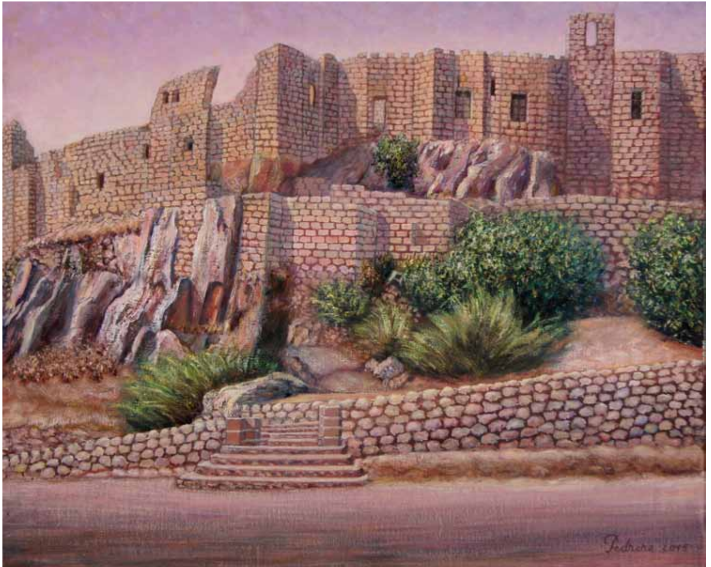
Castillo de Calatrava