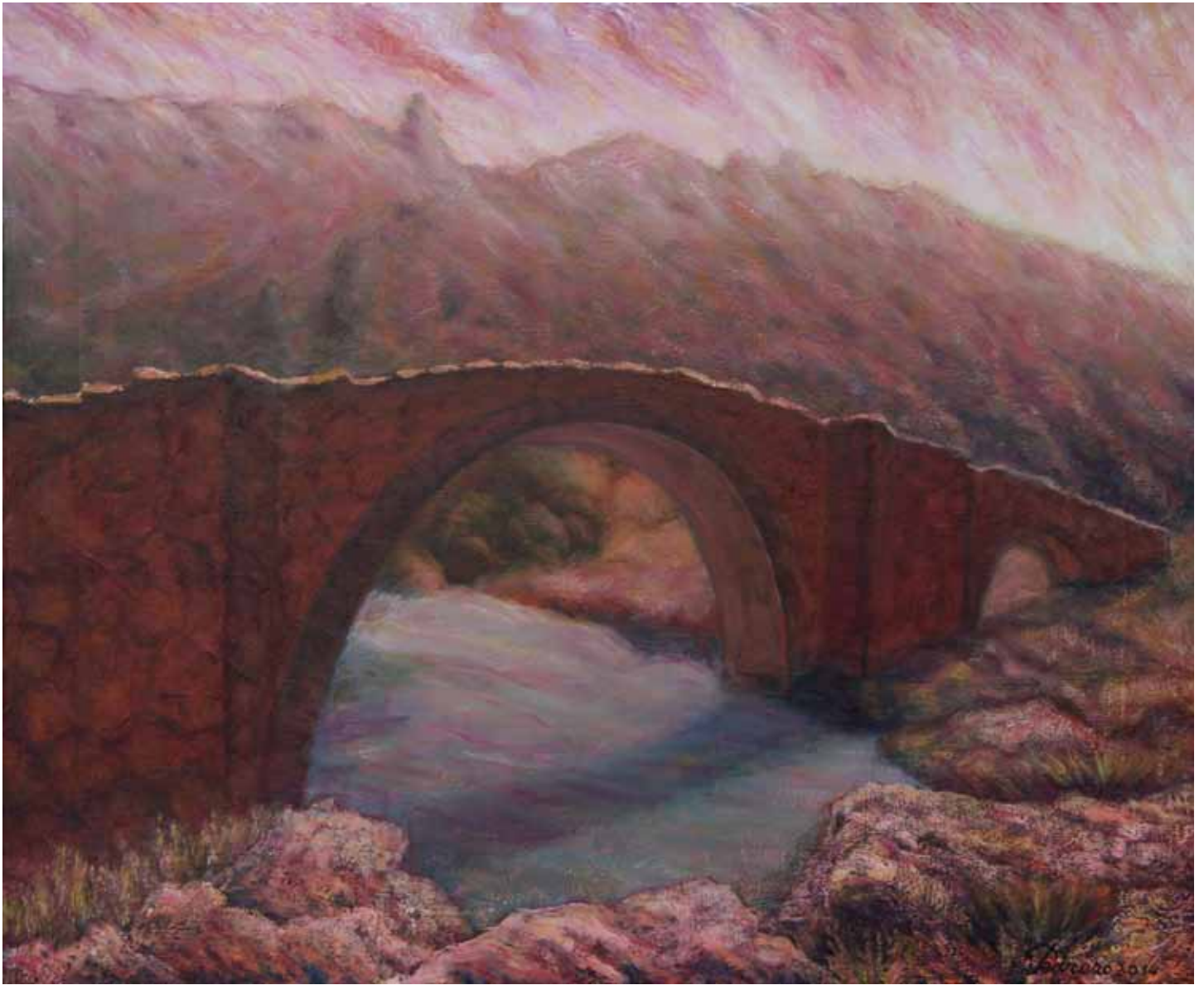
Puente de Cuenca

Uno de los rasgos que a primera vista se presentan ante mí, al iniciar esta breve reflexión en torno a la pintura de Enrique Pedrero, es el alto grado de compromiso que el autor demuestra en su obra. El verdadero artista trabaja según expresión común, “con toda su alma”, y tal expresión debe tomarse aquí en su sentido literal.