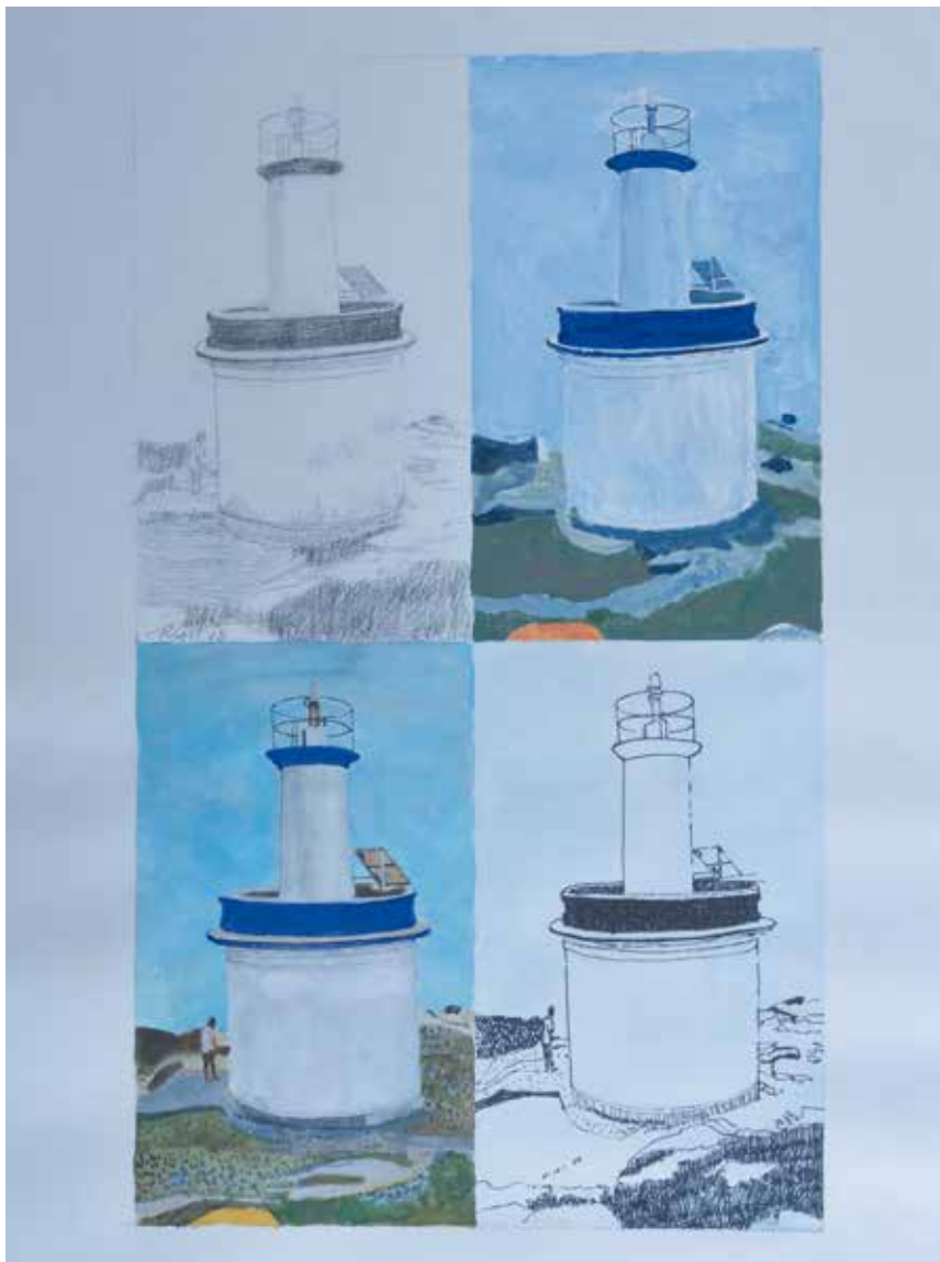
FARO Acrílico, acuarela, lápiz y rotulador sobre papel