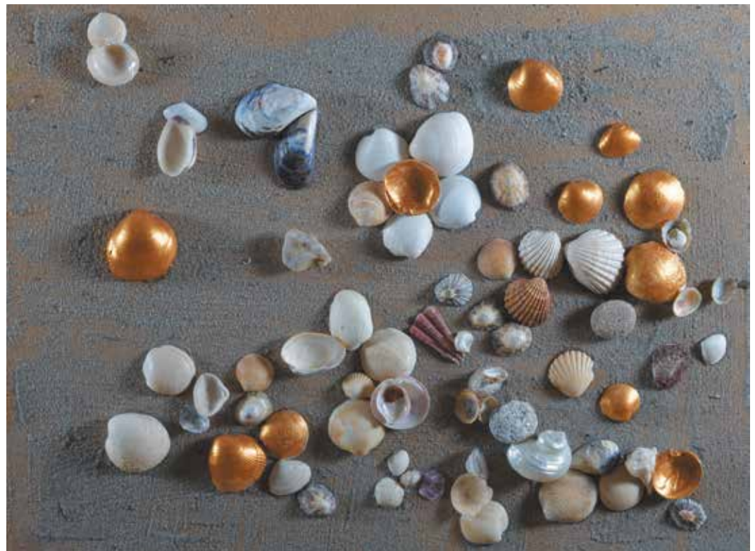
CONCHAS I Técnica mixta sobre tabla