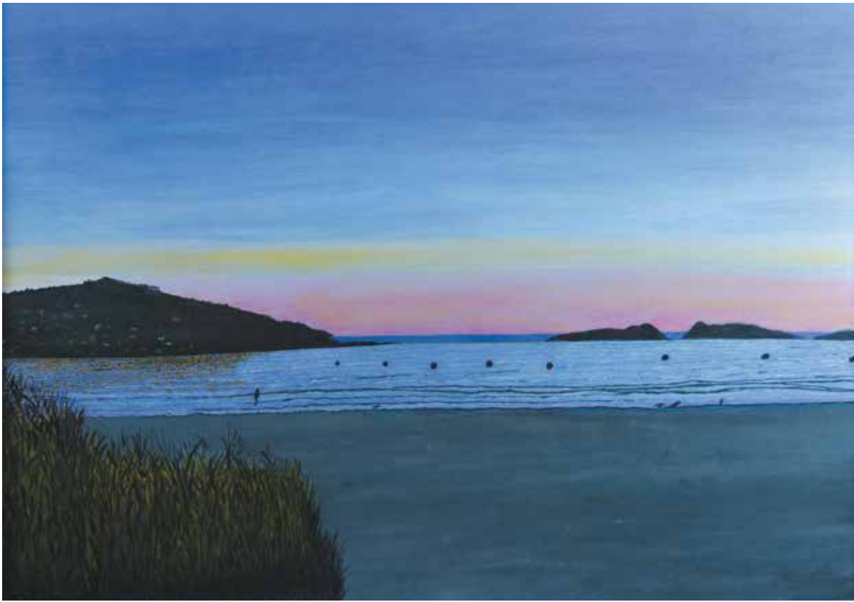
ATARDECER EN LA PLAYA I Acrílico sobre lienzo