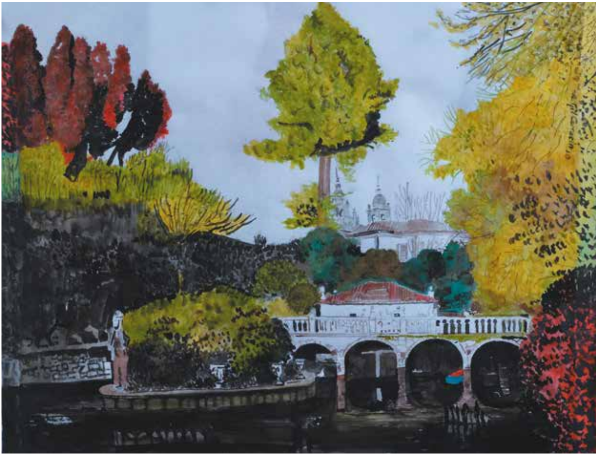
PAZO DE OCA Tintas de colores sobre papel vegetal