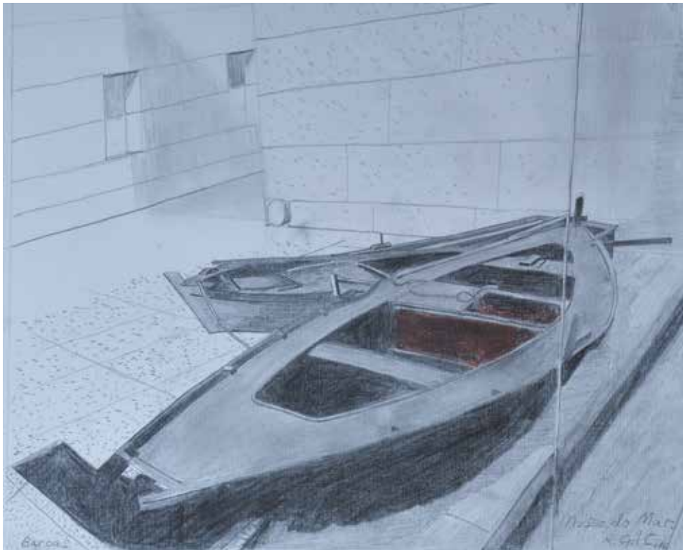
BARCAS. MUSEO DO MAR DE VIGO Lápiz sobre papel