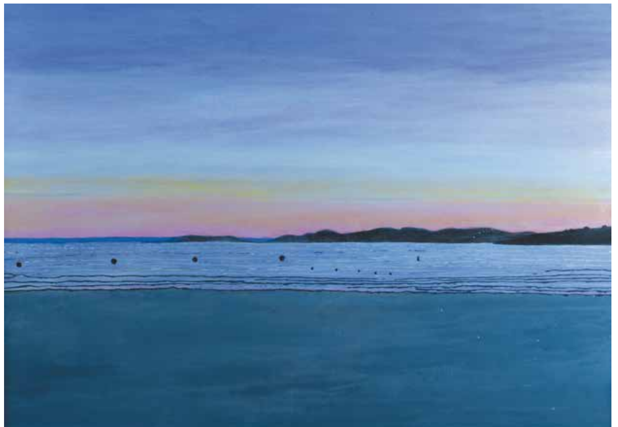
ATARDECER EN LA PLAYA II Acrílico sobre lienzo