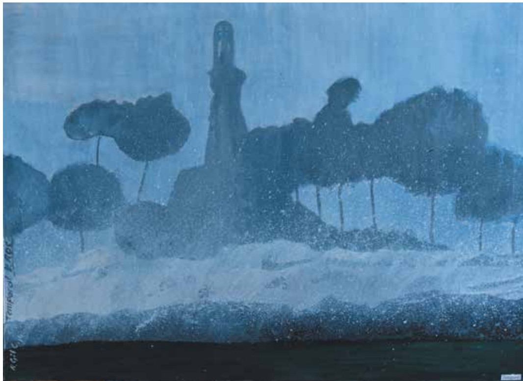
TEMPORAL Acrílico sobre lienzo