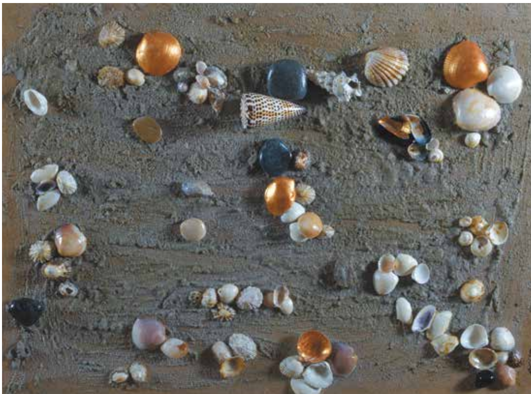
CONCHAS II Técnica mixta sobre tabla