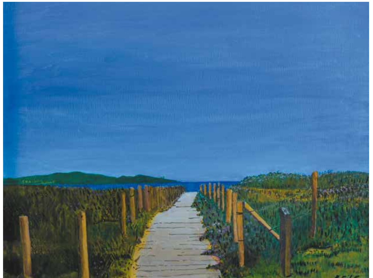
PASARELA EN PLAYA AMÉRICA Acrílico sobre lienzo