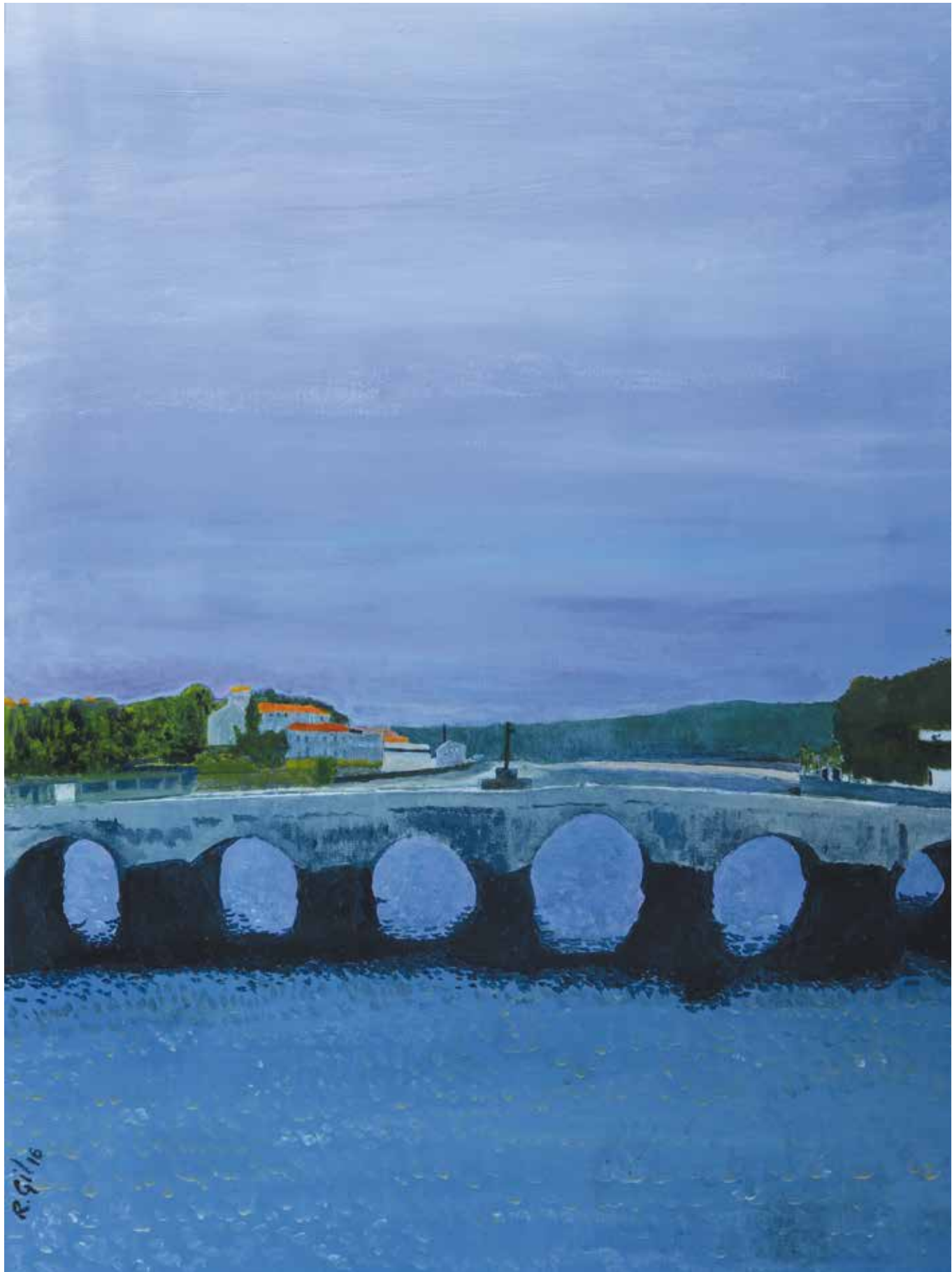
PUENTE ROMÁNICO A RAMALLOSA Acrílico sobre lienzo