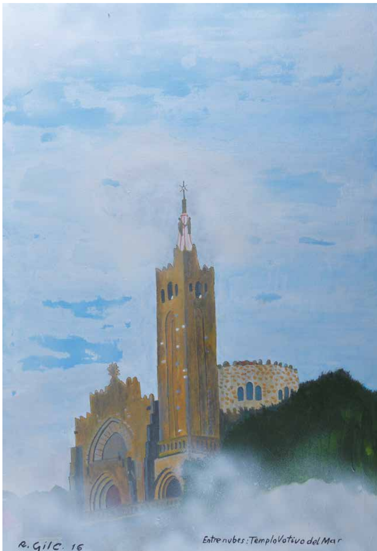
ENTRE NUBES TEMPLO VOTIVO DEL MAR Técnica mixta sobre lienzo