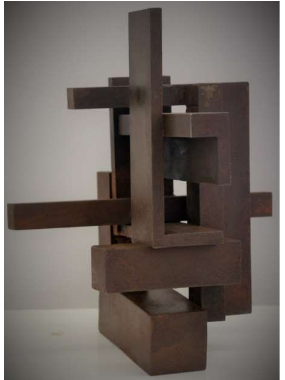
Bloque 2. (Paralelismos). Acero. 40 x 35 x 40